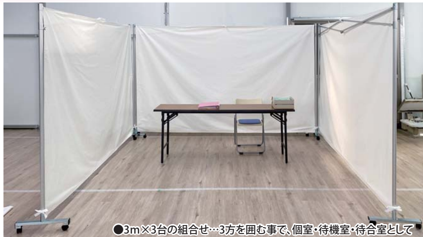
●3m×3台の組合せ…3方を囲む事で、個室・待機室・待合室として