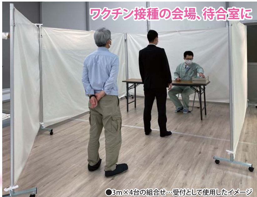
ワクチン接種の会場、待合室に