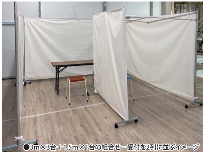
●3m×3台+1.5m×1台の組合せ…受付を2列に並ぶイメージ