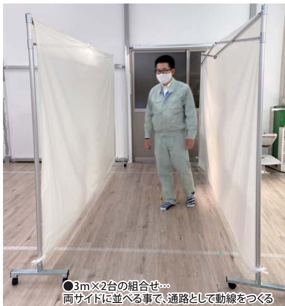
●3m×2台の組合せ… 両サイドに並べる事で、通路として動線をつくる